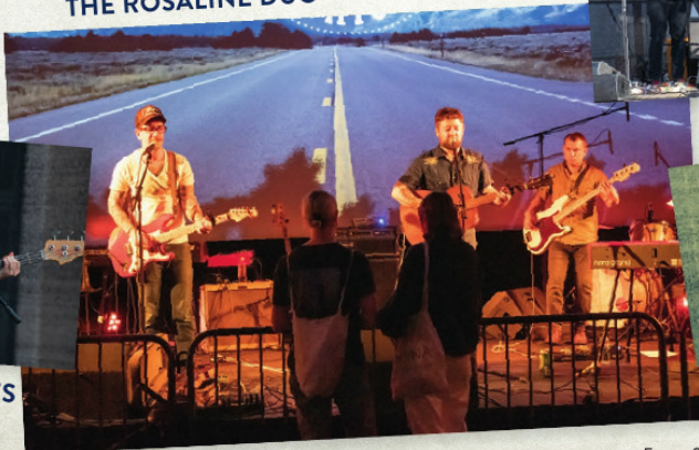
THE SALMON SMOKERS