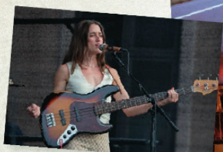
THE BALLROOM THIEVES